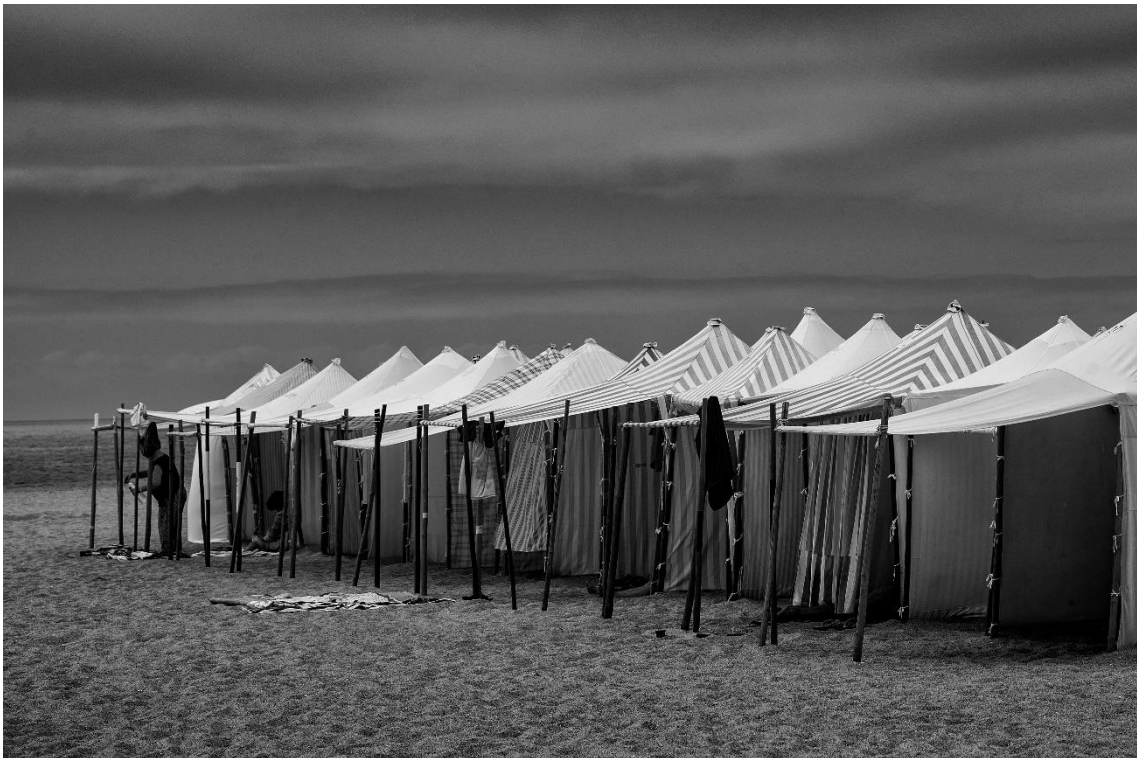
Ilustración 1 PRIMER PREMIO, MAR: PAZ