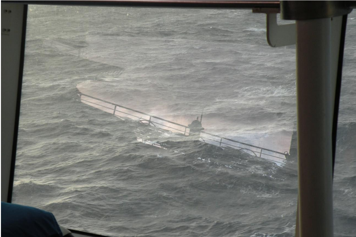
Ilustración 2 SEGUNDO PREMIO, REFLEJO